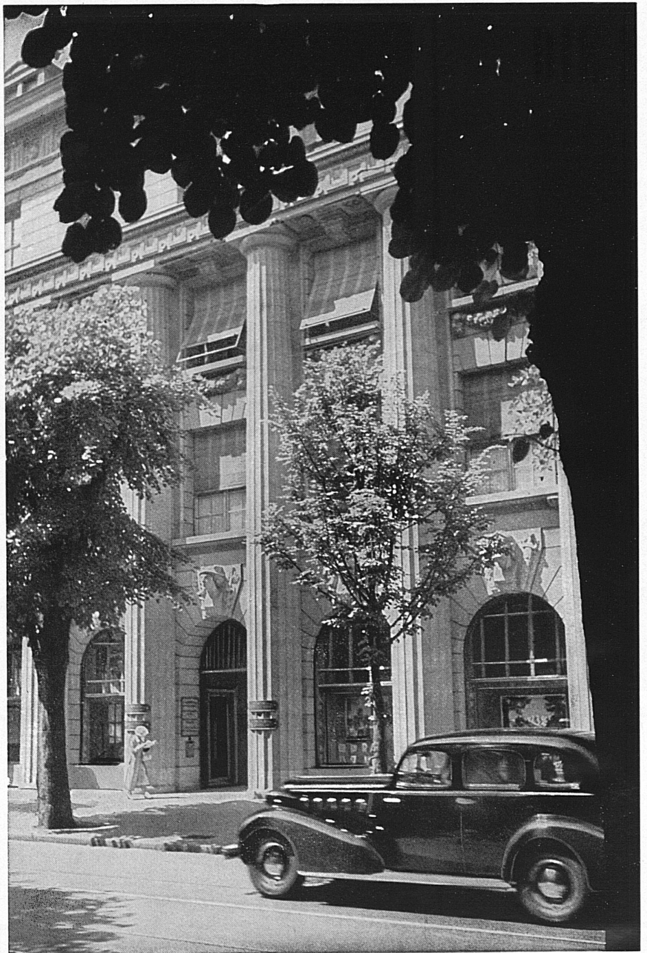
Eingang zum Bankgebäude in Zürich

Hoch überragte der touristische Fahnenmast mit seinen bunten Schildereien von Herbert Leupin die Abteilung der Schweizerischen Verkehrszentrale in der Halle III der Schweizer Mustermesse in Basel und bekundete den Durchhaltewillen des hart betroffenen schweizerischen Fremdenverkehrs. Möge im Laufe des Sommers auf manchem Schweizer Hotel in unsern Kurorten das weisse Kreuz im roten Feld fröhlich flattern, zum Zeichen, dass viele Tausende von Mitbürgern, die im Gastgewerbe tätig sind, dank der treuen Schweizer Kundschaft ihren Beruf auch heute ausüben können.