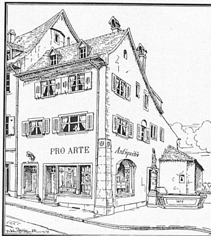
«Zum Laufenburg», Blumenrain Nr. 24, Nähe Hotel Drei Könige

Offen 10-12 und 14-18 Uhr, Mittwoch bis 21 Uhr, Sonntags bis 17 Uhr. Montags geschlossen. Eintritt 1 Fr. Mittwoch-nachmittag, Samstag-nachmittag und Sonntag frei.