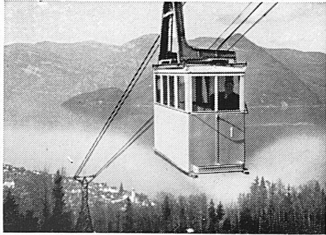
Mit der Luftseilbahn

Dr. ED. KLEINERT · ZÜRICH 8 Neumünsterallee 1 Telephon 2 08 81