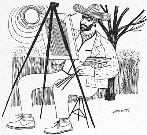
Zürich hat das Glück, die schönsten Werke aus der Reinhart-Sammlung noch bis Ende April in seinem Kunsthauus zu beherbergen