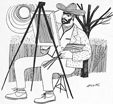
Zürich hat das Glück, die schönsten Werke aus der Reinhart-Sammlung noch bis Ende April in seinem Kunsthau zu beherbergen