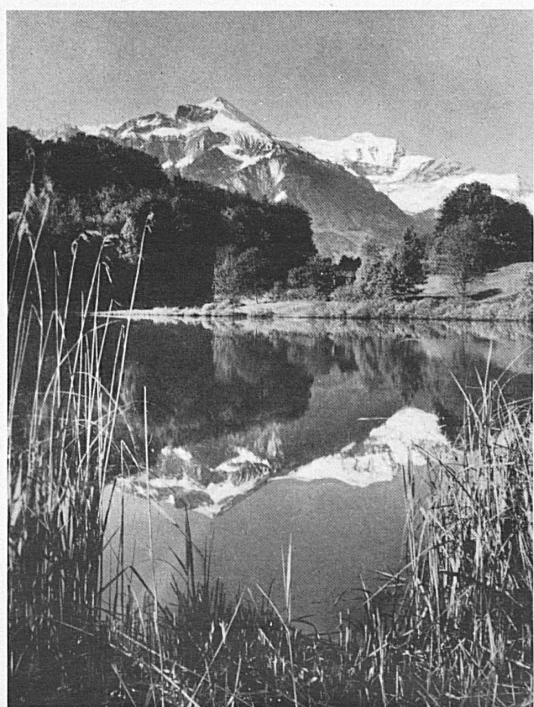
Rechts: Das Faulenseeli-Naturschutzgebiet bei Spiez* — Der Niesen vom Pilgerweg aus gesehen*. Seite rechts, Mitte: Der botanische Garten auf der Schynigen Platte*. Unten: Das Naturschutzgebiet Gwatt und die Berner Hochalpen*