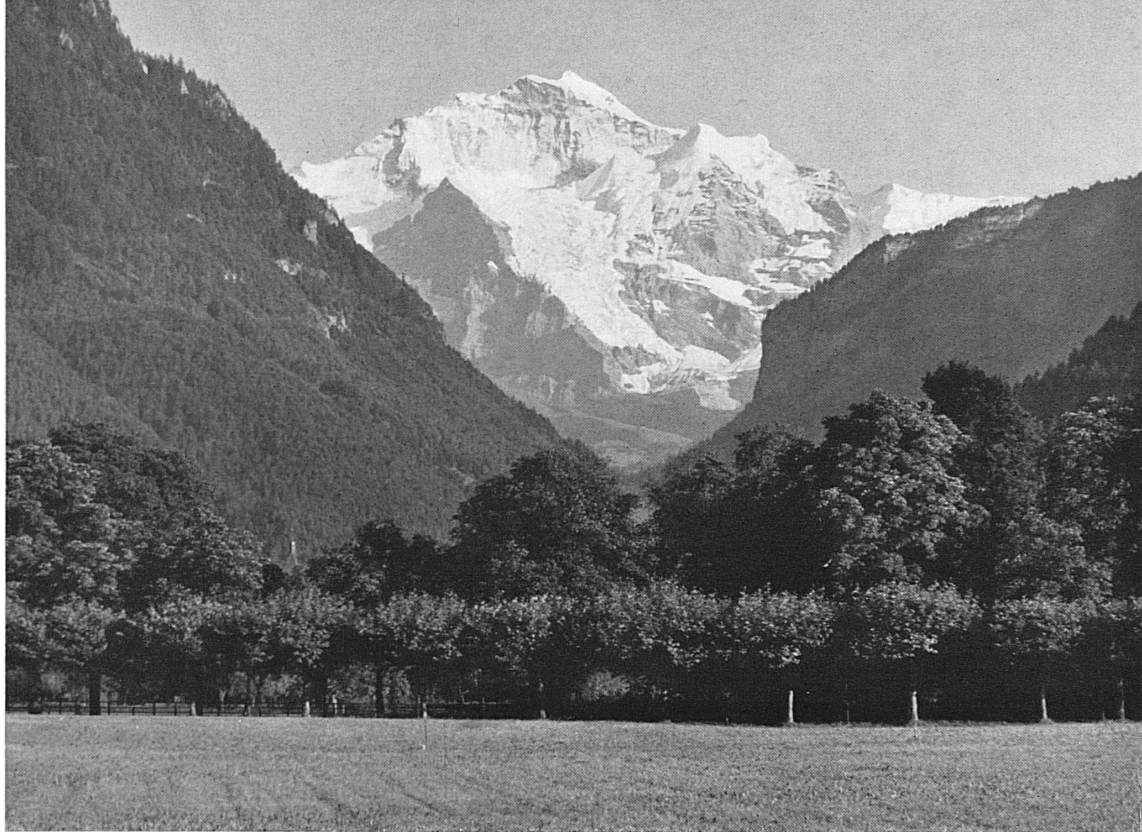
La Høhematte à Interlaken et la Jungfrau* — Die seit 1864 geschützte Höhe- matte in Interlaken und die Jungfrau*