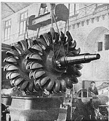
Rotor einer 15000-PS-Turbine Kraftwerk Amsteg der SBB.

Transmissionswellen , komprimiert und abgedreht