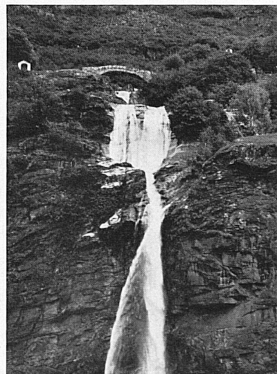
Der Wasserfall von Santa Petronilla — La cascata

Le XVI me siècle est une époque différente, plus aristocratique. Toutefois, contrairement à ce qui se passe ailleurs, l'autonomie des communes et des vallées n'en est pas affectée. Aussi les idées de la Révolution française sont-elles reçues chez nous par des citoyens mûris par de longs siècles de vie politique. Leurs effets furent heureux puisqu'elles ouvrirent la voie à notre Confédération de cantons égaux et souverains. Cependant notre Suisse libre et démocratique ne se concevrait pas sans cette antique tradition d'indépendance, dont la charte de Biasca est un des lumineux épisodes.