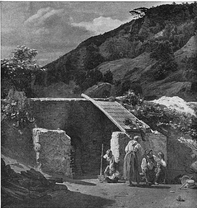
Ferdinand Georg Waldmüller, Wien (1793-1865): Kalkbrennerei.

spüren die Entdeckerfreude, die mit der Erwerbung vieler von diesen Kostbarkeiten verbunden sein mußte. Bisweilen hat der Winterthurer Sammler seine Künstler überhaupt entdeckt, stand er mit ihnen in persönlicher Beziehung und förderte er ihre Entwicklung. Nicht umsonst sind die schweizerischen, deutschen und französischen Meister des 19. Jahrhunderts am zahlreichsten vertreten. Die Liebe des Winterthurer Sammlers wandte sich den Malern zu, die das moderne Naturgefühl, die künstlerische Wahrheit zum Ausdruck brachten, die seinem eigenen Lebensgefühl entsprachen.