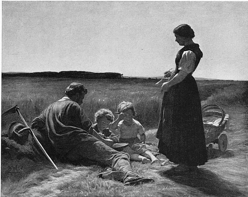
Rudolf Koller (1828-1903): Mittagsmahl auf dem Felde.