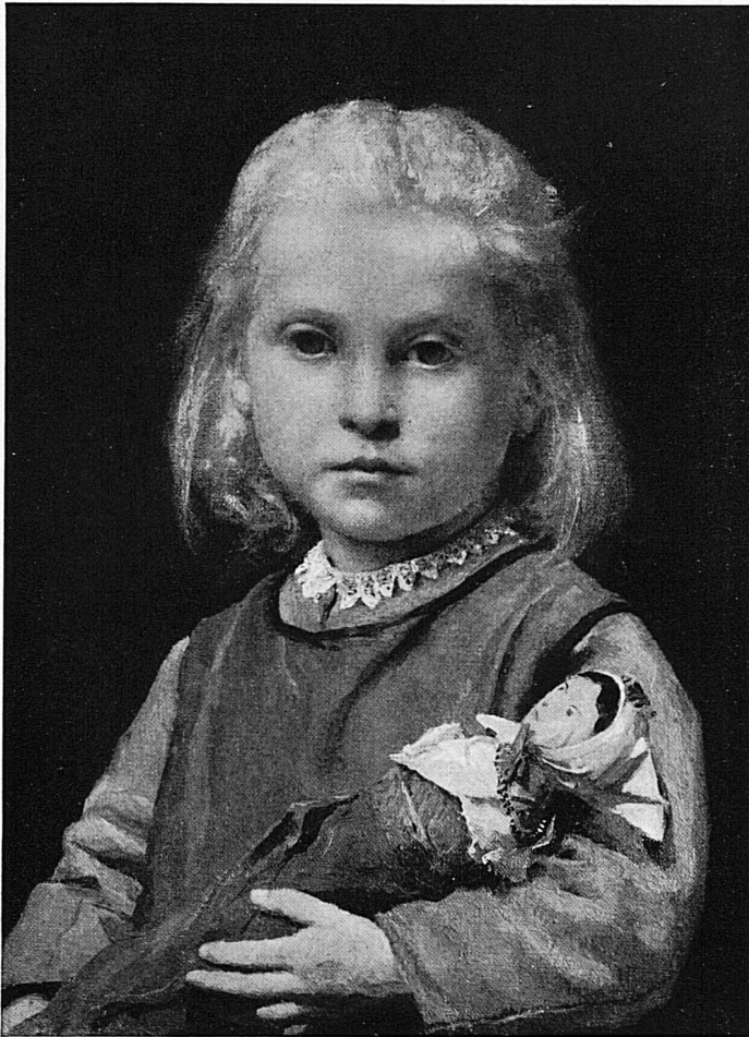
Albert Anker (1831-1910): Mädchen mit Puppe.