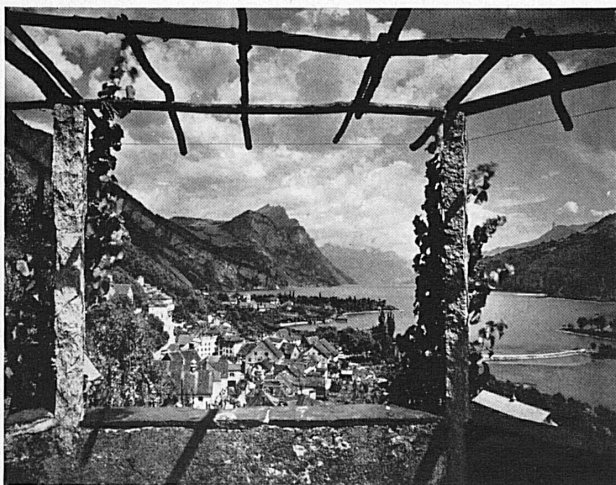
Die entzückende kleine sonnige Stadt Weesen und der Walensee. * Le petit bourg ensoleillé de Weesen et le lac de Wallenstadt. *

Wie oft sind wir schon auf der Reise ins Bündnerland am Walensee vorbeigefahren, immer überrascht und beglückt von der Großartigkeit dieser eigenartigen Landschaft, wo die Wucht der steil aufstrebenden Berge zur Lieblichkeit der schmalen Ufer in einem so wundersamen Gegensatz steht! Haben wir es da nicht jedesmal leise bedauert, im Fluge vorüberzueilen? Am Eingang des Tales grüßte uns Weesen, dann sahen wir gegenüber Quinten in der Sonne liegen, und bald lachten an den glühenden Hängen die Rebberge des Seetzals. Einmal sollten wir unserer Fahrt hier das Ziel setzen und hier verweilen, im Herbst, wenn der Bergwald rings bis an die Felsen der Churfürsten emporflammt. Dieses eine Mal würde nicht das einzige bleiben, und die Kenntnis der Heimat würde bereichert um ein köstliches, geruhsames Erlebnis.