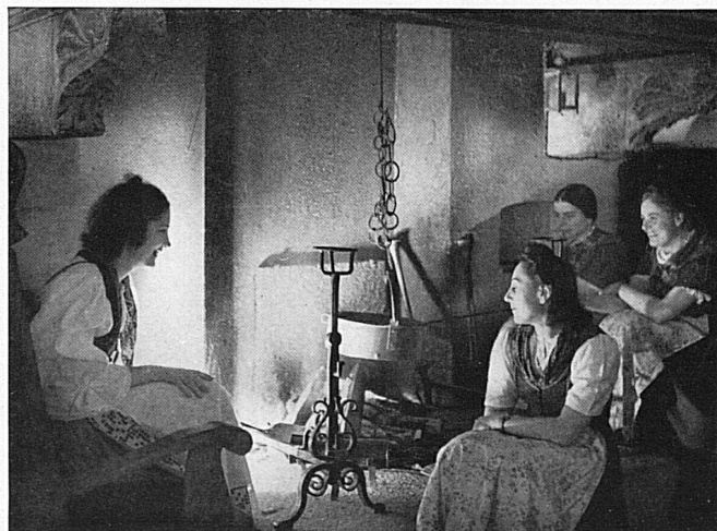
Kommt zur Fiera, kommt über den Gotthard und genießt im goldenen Herbst Tessiner Gastlichkeit und südlichen Charme! — Le Tessin vous souhaite la bienvenue.

Bearbeitung: F. A. Roedelberger Zeichnungen: Werner Stöckli