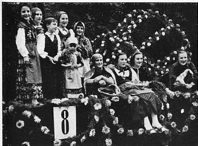
Der ganze, lebenslustige Tessin in einem Festzug, dem letztes Jahr 30 000 Zuschauer applaudierten. Bequeme Sitzplätze. Winzerfest am Sonntag, 4. Oktober. - Festspiel « Confederatio Helvetica » am 3., 10., 17., 18. Oktober. - « Große Revue » am 7., 8., 11. und 14. Oktober. — Le Tessin tout entier dans un cortège qui débordé de vie.

Visiter la Foire suisse de Lugano, c'est joindre l'utile à l'agréable - on y prendra contact avec de nouveaux producteurs et, plus que jamais, on appréciera les produits de nos confédérés tessinois.