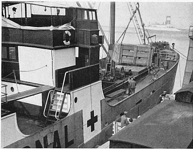
Schiff des Internationalen Roten Kreuzes. Bateau au service de la Croix-Rouge Internationale. Unten: Liebesgabenpakete. — En bas: Des paquets partent pour toutes les régions du monde. Ein Kartotheksaal der Zentralstelle. — Une salle de carthèque de la Centrale.