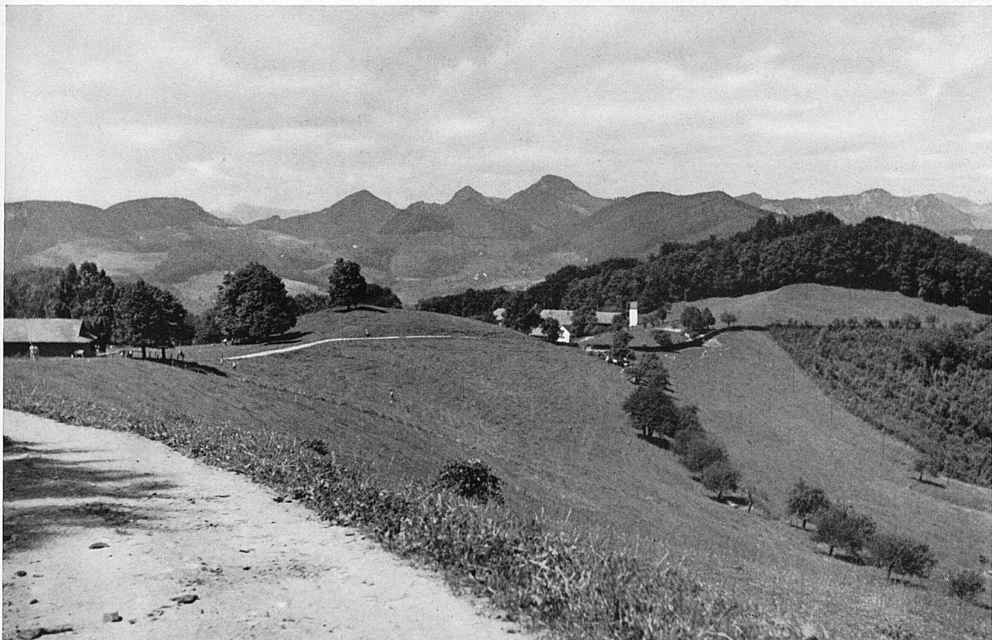
Phot.: Schweiz. Juraverein *