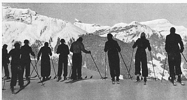
Skischule Wengen* A l'école suisse de ski de Wengen