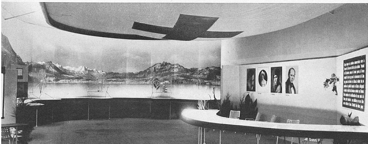
En haut à gauche: Le livre suisse à la Foire d'automne de Vienne (21-28 septembre 1941). En haut à droite: «La Suisse, terre de guérison» à la Foire de Leipzig (31 août-4 septembre 1941). A côté du titre: Le Pavillon suisse à la Foire internationale du Danube de Bratislava (31 août-7 septembre 1941). Au milieu à gauche: Pour la première fois l'OCST a figuré à la Fiera Svizzera di Lugano, notre Foire du Midi, en mettant en relief le mot d'ordre de l'année: Va, découvre ton pays - Va, ammira la tua patria! En bas: En France la Suisse a pris part aux deux grandes foires de Marseille (13-28 septembre) et de Lyon (27 septembre-5 octobre). Une vue du stand suisse de Marseille.