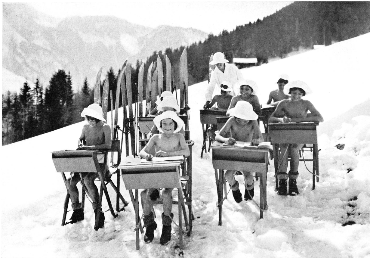
Freiluftunterricht in der Wintersonne von Leysin.*

oder Mikroben (infektiöse Hautkrankheiten): sie wird auch zu einem eigentlichen Strahlungsenergie-Speicher.