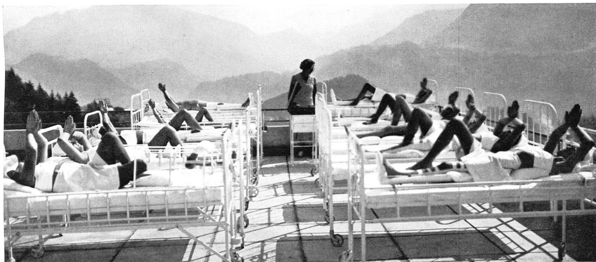
Heilgymnastik und Sonnenkur in Leysin*

Die erneuernde Wirkung der alpinen Heliotherapie kommt allen Teilen des Körpers zugute. Erstens der Haut, deren mannigfaltige physiologische Funktionen durch solch maßvollen Kontakt mit Luft und Sonne neu angeregt und gesteigert werden, so daß sie zum denkbar wirksamsten Verteidigungssystem des Organismus wird: Schutzfunktion, Funktion des Kreislaufs, der Innervation, der Ausscheidung — aber auch der äußeren und inneren Sekretion, denn die Haut ist eng verbunden mit dem endokrinen System, sie beeinflusst es und wird wiederum von ihm beeinflusst. Es sei daran erinnert, daß die direkte Einwirkung der Sonnenstrahlen auf die Haut in dieser das Vitamin D erzeugt, das zur Entwicklung des Knochensystems unentbehrlich ist. Die Bestrahlung hebt die keimtötenden Kräfte in den Hautgeweben; sie begünstigt die Pigmenterzeugung, welche ihrerseits der Haut bemerkenswerte antiseptische Fähigkeiten verleiht. Pigmentierte Haut ist nicht nur widerstandsfähig gegen physische Einflüsse (Kälte und Wärme)