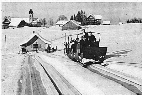
Schlittenseilbahn Heiligkreuz-First bei Hasle im Entlebuch