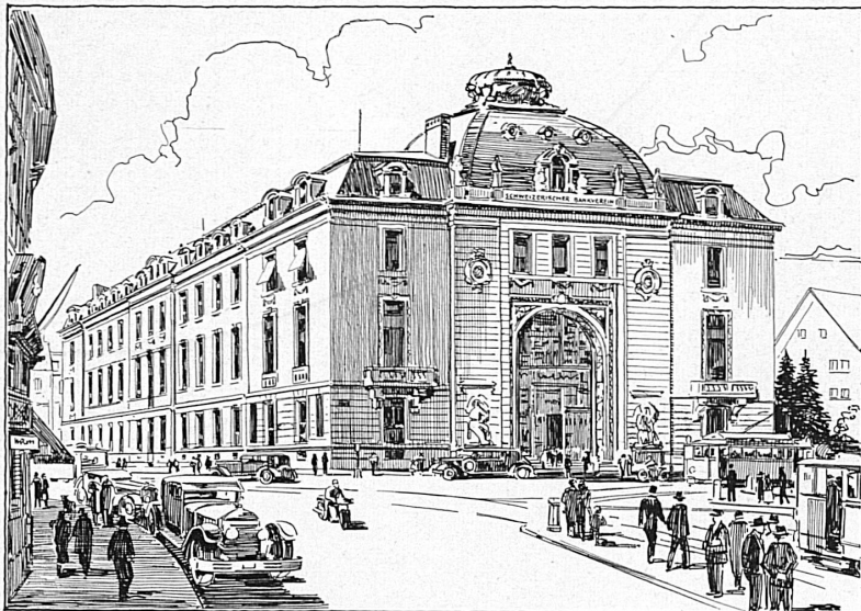
Bankgebäude in Zürich — Hôtel de la banque à Zurich