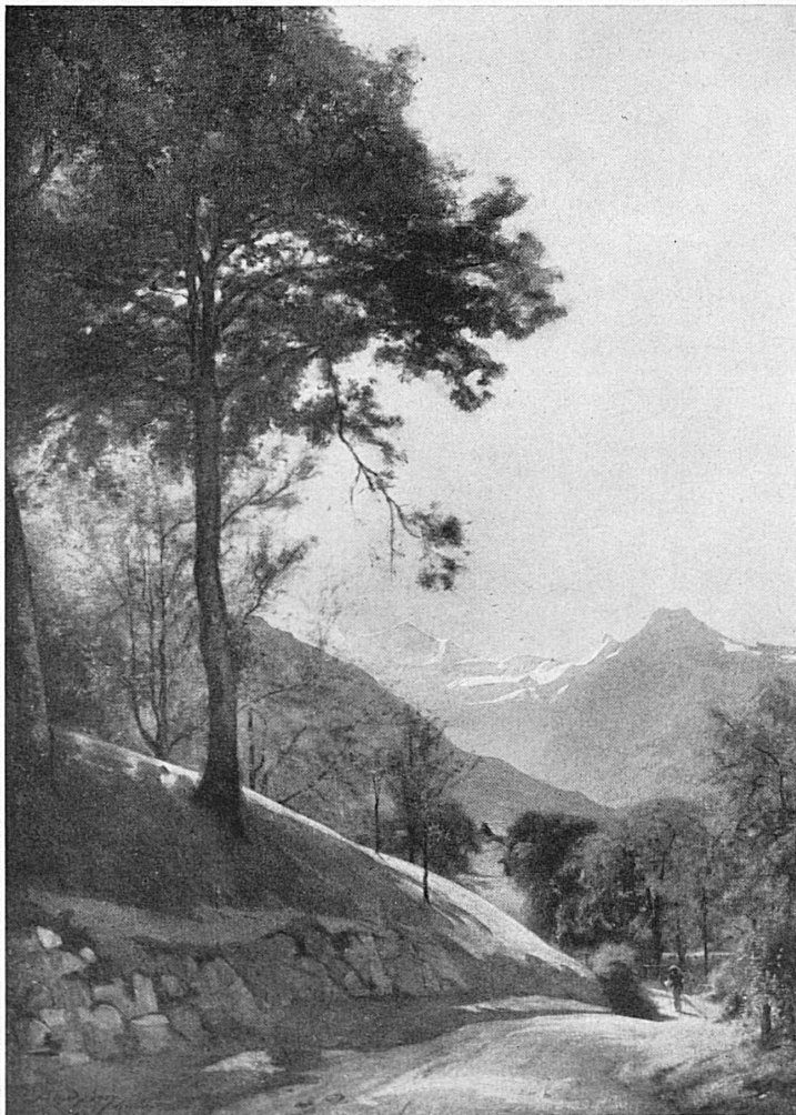
Oben: Giovanni Segantini: Aus dem Triptychon der Alpenwelt. Unten: Auguste Baud Bovy: Landschaft bei Aeschi. En haut: Giovanni Segantini: Partie du Triptyque des Alpes. En bas: Auguste Baud Bovy: Paysage près d'Aeschi, lac de Thoune.

Seit 50 Jahren widmet sich die Eidgenössische Gottfried-Keller-Stiftung der schweizerischen Kunstpflege und ist für die Erhaltung älteren wertvollen Kunstgutes und für die Förderung lebender Künstler besorgt. Zum Jubiläum dieser schönen Institution veranstaltet das Kunstmuseum Bern eine Ausstellung, die uns einen prächtigen Überblick über die vielseitige Tätigkeit der Stiftung gibt. Um den Besuch der Schau möglichst zahlreichen Schweizern zu ermöglichen, gewähren die Bahnen im Wochenende vom 18./19. Juli, 29./30. August 12./13. September die Vergünstigung « Einfach für Retour » nach Bern.