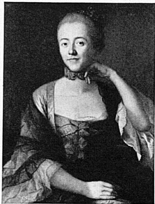
Anton Graff: Die Frau Salomon Gessners. Edouard Vallet: Bäuerin. Altarschrein der Kirche von Unterschächen, St. Anna selbdritt und Heilige (1521). Anton Graff: Portrait de la femme de Salomon Gessner. Edouard Vallet: La paysanne. Retable provenant de l'église d'Unterschächen et représentant Ste Anne, la Vierge, l'enfant Jésus et deux saints (1521).