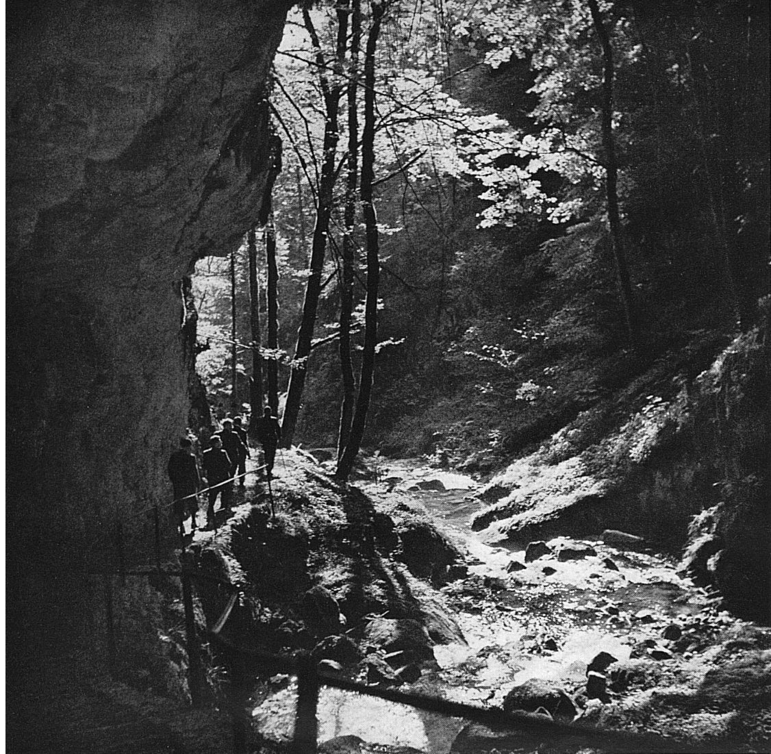
Links: Auf Jura-Wanderwegen. In der Twannbach-Schlucht.* Rechts: Blick auf die Hohe Winde im Solothurner Jura.*