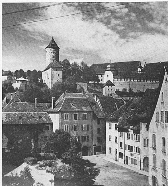
Links: Alter Turm in Delsberg.* Pruntrut.* Rechts: Môtiers, Val de Travers, Neuenburger Jura. Der Etang de Gruyère auf der weiten Hochebene des Berner Jura.*