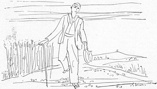
Vignette über Titel: Zeichnung von Gerbig aus der Sommerbroschüre 1943. Oben: Doppelseite «Sitten» aus der Revue «Die Schweiz». Vignette unten: Zeichnung von Heinrich Steiner aus dem von der SZV herausgegebenen Buch «Gang lug d'Heimat». Rechts oben: Plakat von Herbert Matter. Rechts unten: Plakat von Alois Carigiet.