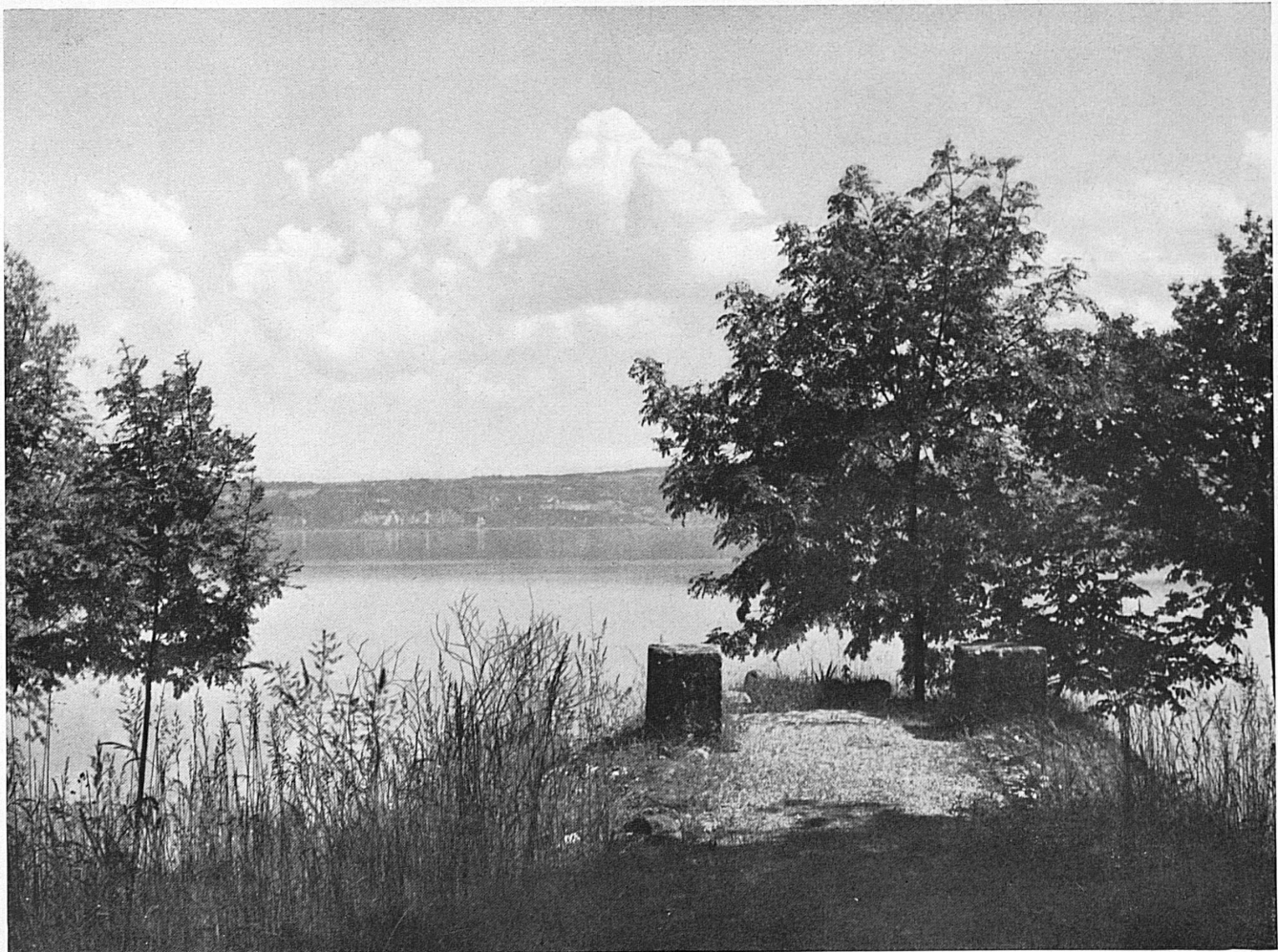
Au bord du lac de Neuchâtel près de Vaumarcus. Bei Vaumarcus am Neuenburgersee.*