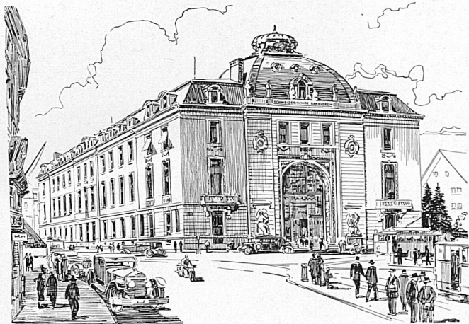
Bankgebäude in Zürich — Hôtel de la banque à Zurich