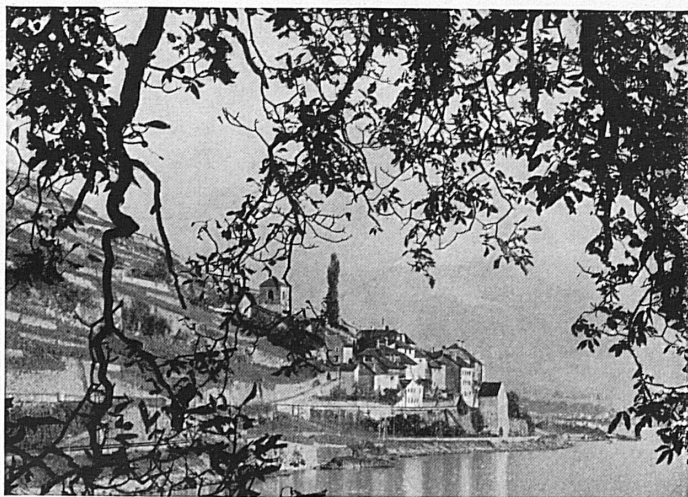
Das malerische St-Saphorin bei Vevey

11, Rue du Mont-Blanc Téléphones 2 64 20/29 Télégrammes: Louvialco