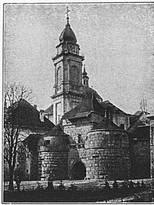
Solothurn: Baseltor und St.-Ursus-Kathedrale

in einstündiger, abwechslungsreicher Fahrt durch das anmutige Fraubrunnenamt und den waldreichen Bucheggberg nach dem