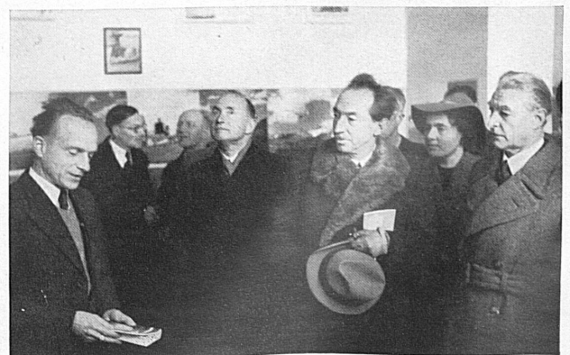
Oben links: Auf dem Untersee. Oben rechts: Generalversammlung SZV in Neuenburg (1942). Unten: Besuch der Luftfahrtausstellung «Auf der Weltstraße der Zukunft» im Berner Kunstmuseum.