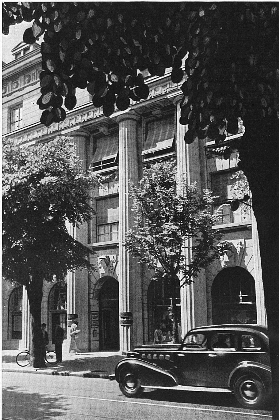
Eingang zum Bankgebäude in Zürich