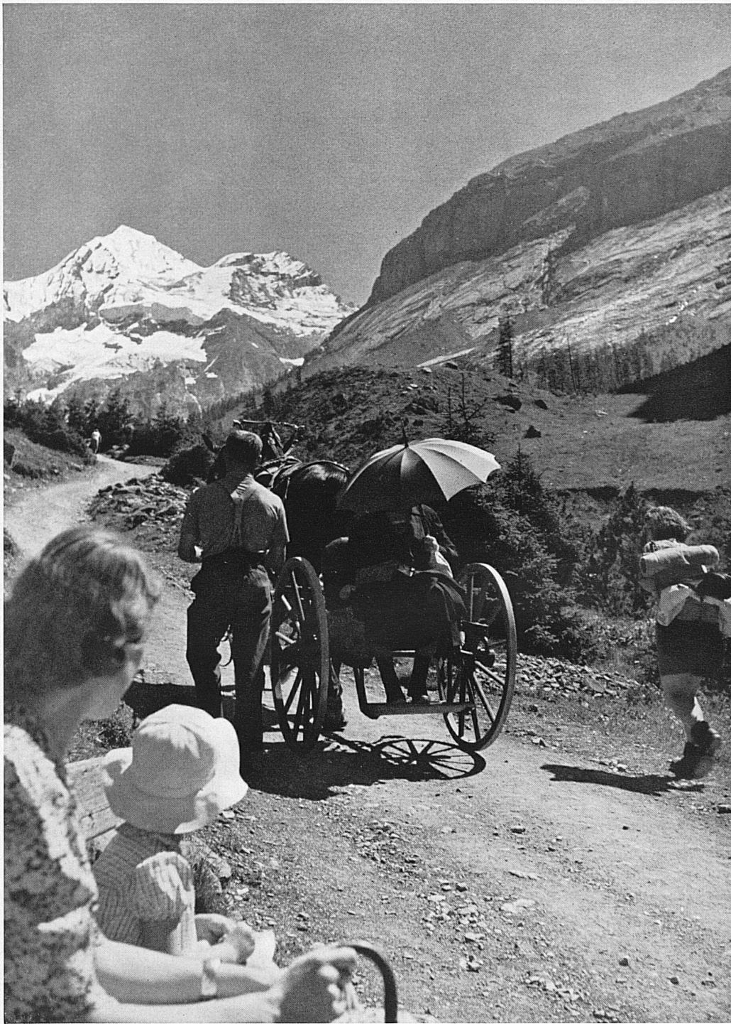
Blümlisalp bei Kandersteg*