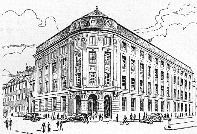
Bankgebäude in Basel — Hôtel de la banque à Bâle

☆ SCHWEIZERISCHER BANKVEREIN ☆ SOCIÉTÉ DE BANQUE SUISSE ☆