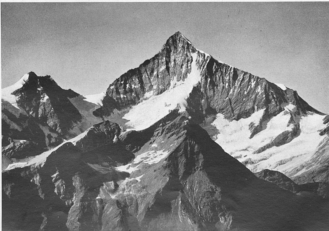
Schallhorn und Weißhorn vom Gornergrat aus gesehen.* Le Schallhorn et le Weisshorn vus du Gornergrat.