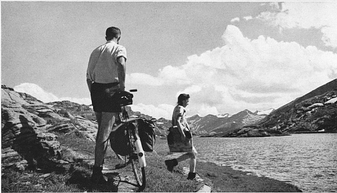
Der kleine Bergsee auf der Paßhöhe des San Bernardino.* Le petit lac au col du San Ber- nardino.