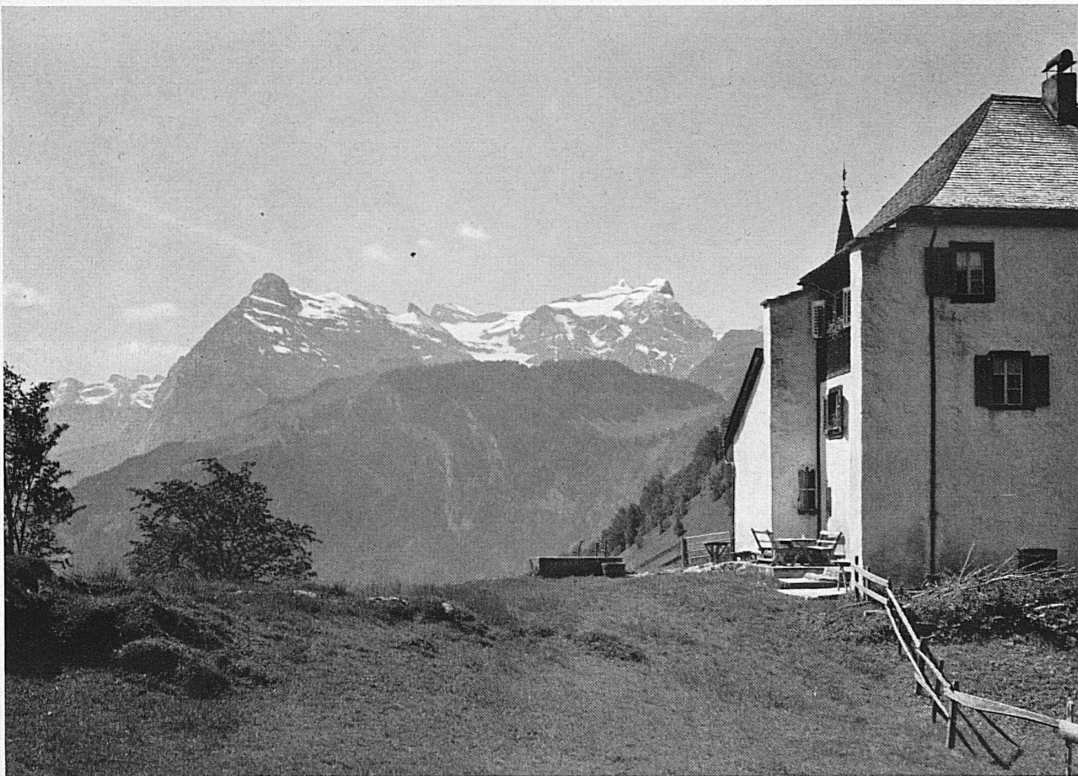
Jagdschlößchen Beroldingen und der Urirotstock.* Le pavillon de chasse de Berol- dingen et l'Urirotstock.