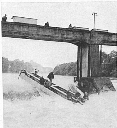
Durchfahrt durch ein Stauwehr (Zensur Nr. V/730).