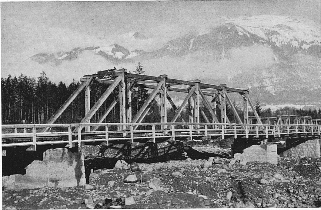
Durch Pontoniere erbaute Straßenbrücke über die Große Schlieren in Obwalden (Zensur Nr. V/728).