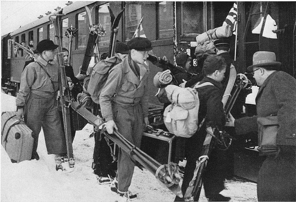
Links: Ferienbeginn. — Stoßzeit in den großen Bahnhöfen der SBB. — Unten: MOB.* — Leukerbadbahn. — Schwebebahn Gerschnialp-Trübsee ob Engelberg.* — Seite rechts, oben: Die Bahn nach der Scheidegg wird freigelegt* — Unten: Chur—Arosa-Bahn.*