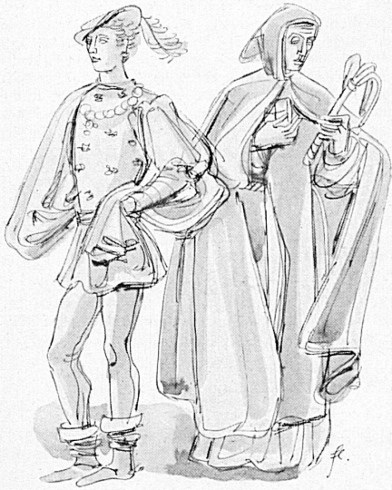
Kostümskizze zum « Großen Welttheater » von Anton Flüeler : Kavalier und Mönch

tet. Man hält sich getreu an die geradezu klassisch schöne Übersetzung Eichendorffs, deren überquellende Lyrismen nur im intimen Raume zur Wirkung kommen. Bei einer Monumental-Inszenierung muß man gewissermaßen freskohaft mit der Dichtung umspringen. Man darf sich freuen, in Bad Ragaz