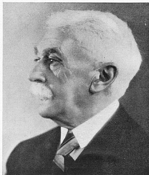
En haut: Le Léman à Lausanne. A gauche: Le Baron Pierre de Coubertin, rénovateur des Jeux olympiques, citoyen d'honneur de la ville de Lausanne, mort à Genève le 2 septembre 1937. Oben: Der Genfersee bei Lausanne.* Links: Baron Pierre de Coubertin, der Erneuerer der olympischen Spiele, Ehrenbürger von Lausanne, gestorben in Genf am 2. September 1937.

mondiale, soit en 1915, avec le consentement du Conseil fédéral le Baron de Coubertin fixa définitivement le siège du Comité international olympique à Lausanne, où il fondait un Institut olympique, le premier de ce genre au monde et qui existe encore, et où, en groupant les challenges et souvenirs des Jeux olympiques, il constituait un musée qui fut installé à Mon Repos. Au lendemain de la guerre, soit en 1919, c'est au siège du C. I. O., à Lausanne, qu'il convoqua la session de ce comité dont on commémora le 25 me anniversaire en présence du président de la Confédération, Gustave Ador. Les Lausannois ont souvenance des brillantes fêtes de ce Jubilé olympique, rehaussées par l'arrivée d'une escadrille d'aviateurs français envoyés par le premier ministre Clemenceau qui avait ainsi voulu marquer la haute estime en laquelle il tenait le C. I. O. et son œuvre, et en même temps manifester sa sympathie à la Suisse.