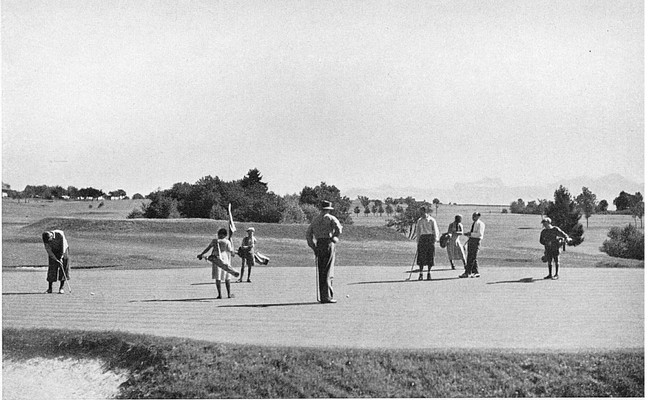
Le golf de Lausanne. Der Lausanner Golf- platz.*

plus guère que des romans. Dévorés au bord de l'eau... Nulle ville plus que Lausanne a autant de ressources en été. Elle a des plages exquis; Bellerive, qui est immense et, on dirait presque, confortable, si le mot pouvait convenir à une plage. Ouchy-Plage qui clapote dans une atmosphère de luxe tranquille. Bellerive et Ouchy-Plage, avec leurs installations extrêmement modernes, combleraient les villes lacustres les plus exigeantes. Mais je vous disais que notre coquette ne faisait pas les choses à demi. Elle s'est offert encore une piscine établie selon les canons olympiques. Et elle l'a plantée au cœur de la ville, pour éviter à ses hôtes de descendre jusqu'au lac. On n'est pas plus prévenant! Lausanne aux bras nus, quand elle est lasse des plaisirs du bain, passe un short et, sautant élégamment par-dessus le filet, annonce, selon la formule: «ready!». C'est-à-dire prête à affronter tous les amateurs de tennis du monde entier. Elle a des