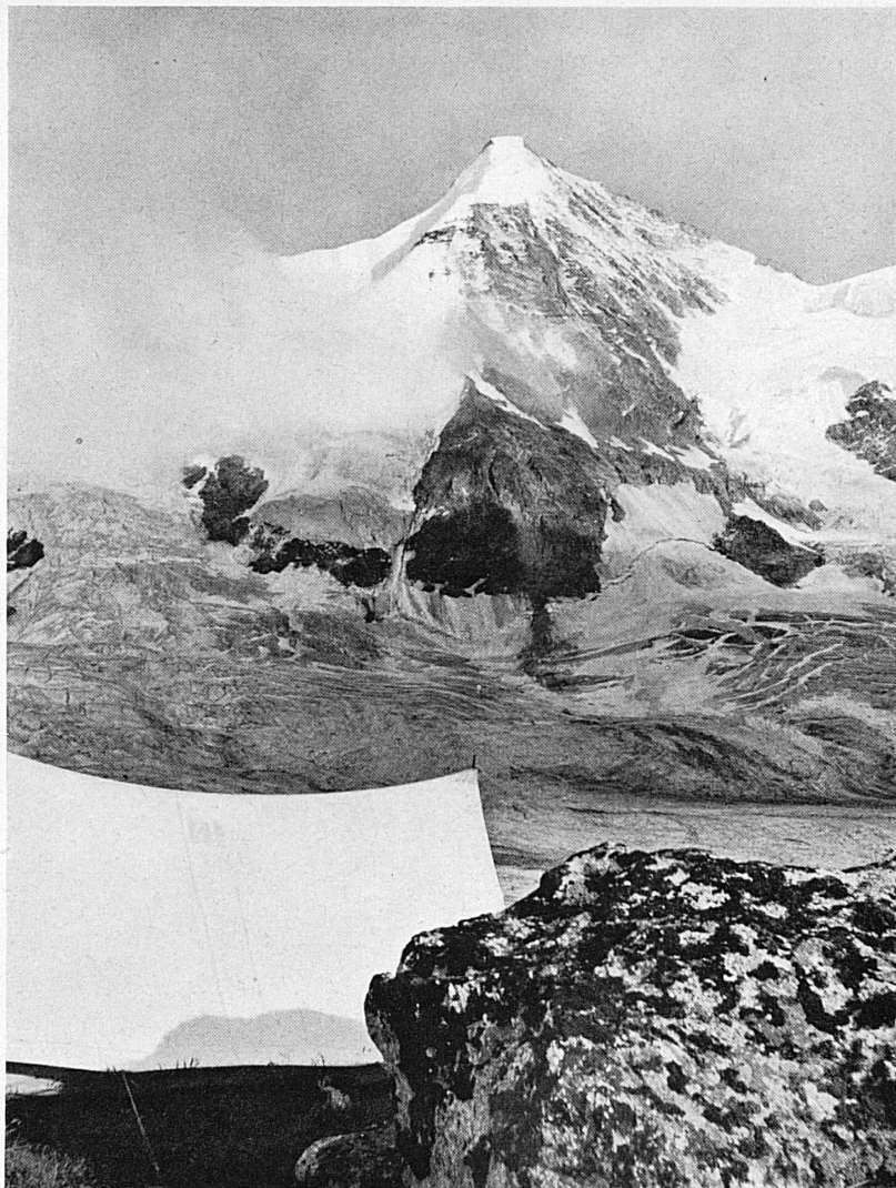
Obergabelhorn im Wallis.* — L'Obergabelhorn en Valais.

Les glaciers se composent de deux parties: le névé ou bassin d'alimentation et le glacier proprement dit. Si l'écoulement de la glace apporte une masse plus grande que celle qui disparaît en eau par la fonte ou ablation, le glacier croît et avance. Si c'est le contraire, il diminue de volume et son extrémité infé-