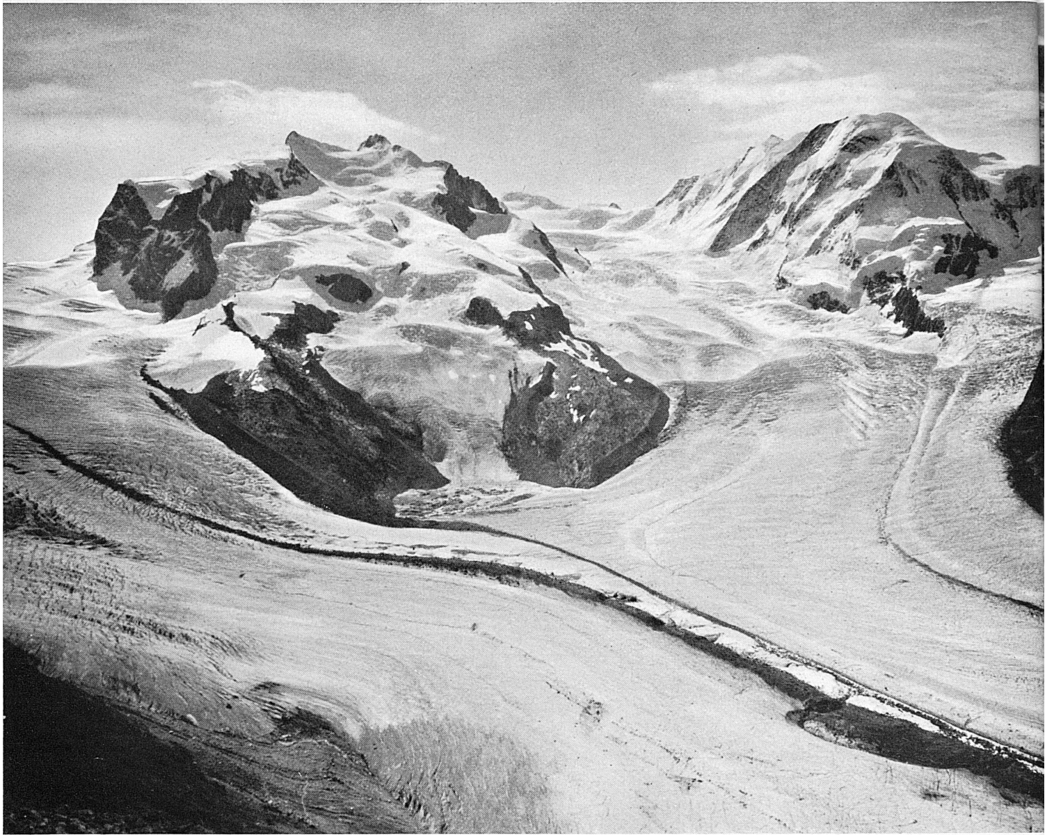
Mont-Rose. — Monte Rosa.*

forment en glace sous l'action de la fonte et du regel, puis sous l'effet de la pression. En dessous de la limite du névé, l'ablation enlève annuellement une certaine épaisseur superficielle de glace, en sorte que, dans la langue terminale, les vieilles couches remontent peu à peu vers la surface du glacier. Ce mouvement a été souvent observé. Un guide ayant laissé tomber son piolet dans une crevasse à la hauteur de Concordia sur le grand glacier d'Aletsch, le retrouva quinze ans plus tard, un peu plus bas, mais à la surface. Les cadavres des alpinistes perdus sur un glacier ressortent dans les parties inférieures de ces glaciers.