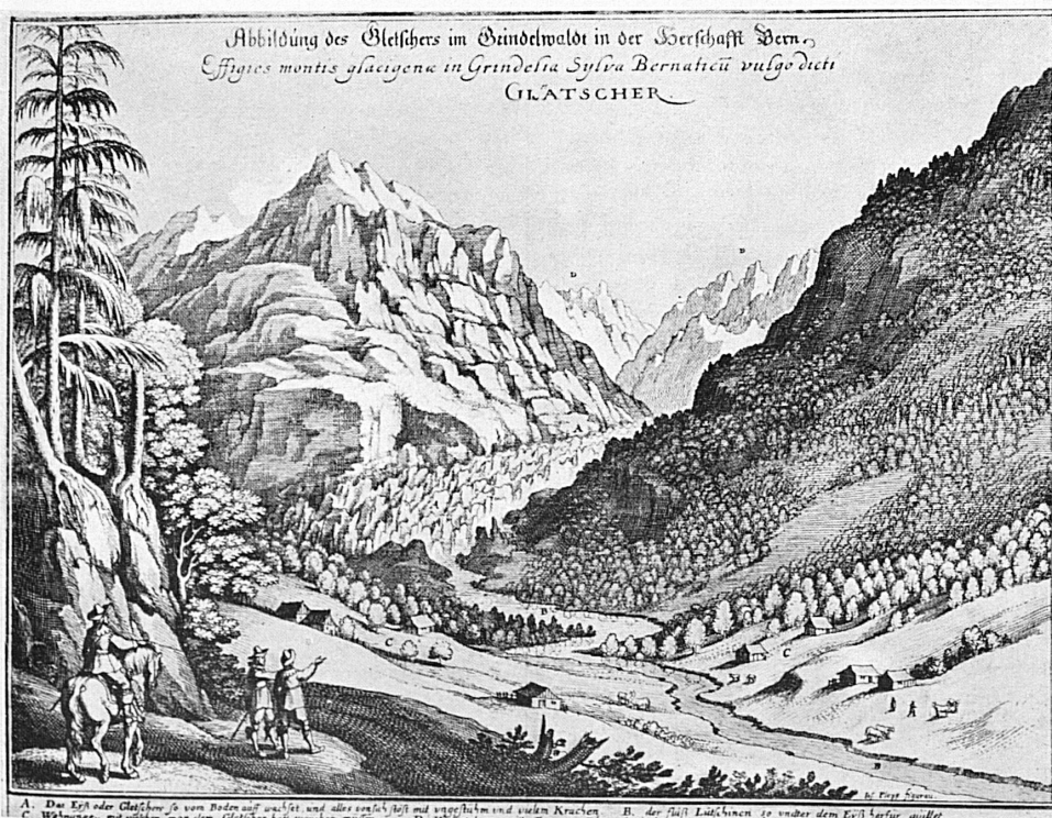
A gauche: Le glacier de Grindelwald vu par Merian («Topographia Helvetiae» 1644). Links: So sah Merian den Grindelwaldgletscher (Topographia Helvetiae 1644).

Dans les hautes régions, chaque hiver apporte une nouvelle couche de neige qui devient de plus en plus épaisse au fur et à mesure que l'altitude augmente. Cette neige en s'écoulant alimente le glacier. Le névé, lui-même, s'accroît aussi chaque année d'une nouvelle épaisseur de neige. Ces couches successives passent ainsi peu à peu en profondeur et se trans-