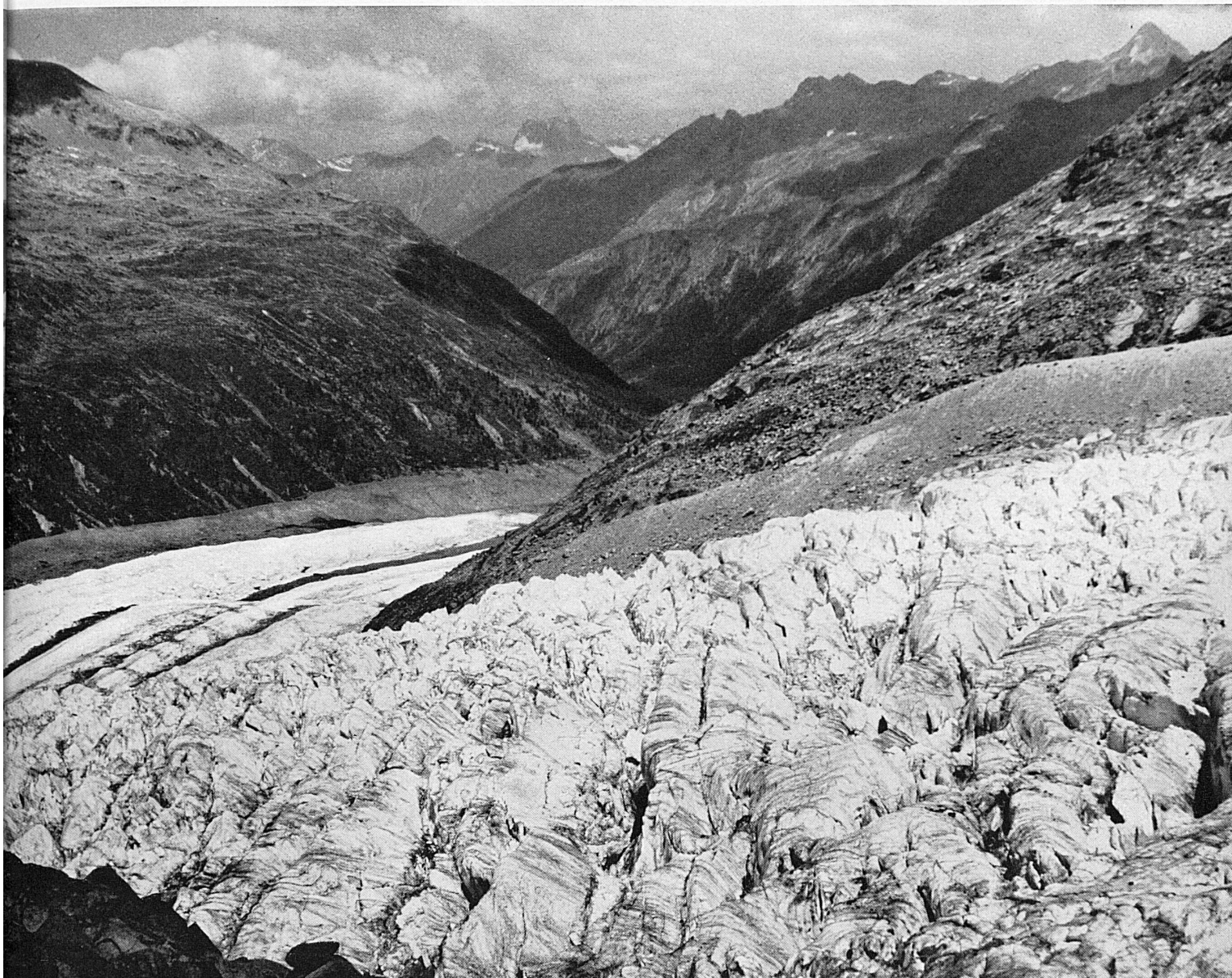
Glacier de Pers (Engadine). Der Abbruch des Persgletschers im Engadin.*

au moins (on a mesuré du reste plus de sept cent quatre-vingts mètres d'épaisseur sur le glacier d'Aletsch à la place Concordia), il est fort probable que les crevasses ne le traversent pas jusqu'au fond. On se rend compte du rôle que joue cette pression car, indépendamment de l'inclinaison, un glacier épais avance beaucoup plus vite qu'un glacier mince, qui reste, en général, presque stationnaire, même sur une pente raide.