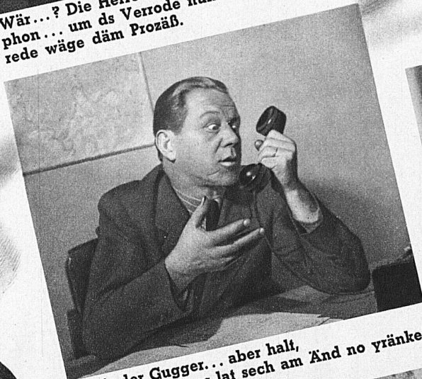
Hol's der Gugger... aber halt, es lat sech am Änd no yränke!