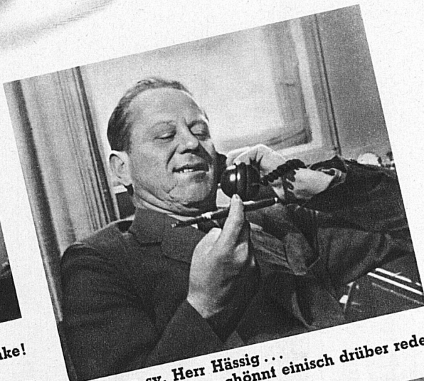
...s ma sy, Herr Hässig... me chönnt einisch drüber rede.