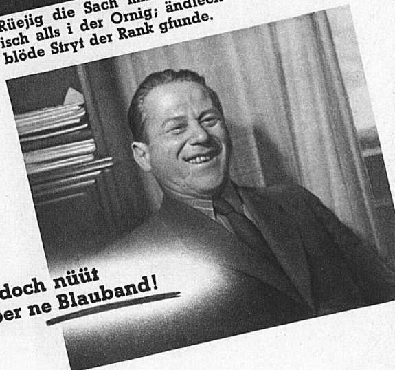
Es geit halt doch nüüt über ne Blauband!