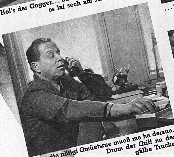
Aber die nöngi Gmüetsrue mueß me ha derzue. Drum der Griff na der gälbe Trucke.