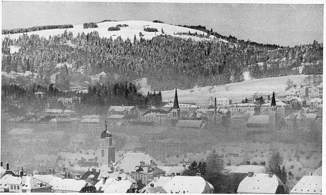
La Chaux-de-Fonds en hiver. — Winterliches La Chaux-de-Fonds.*