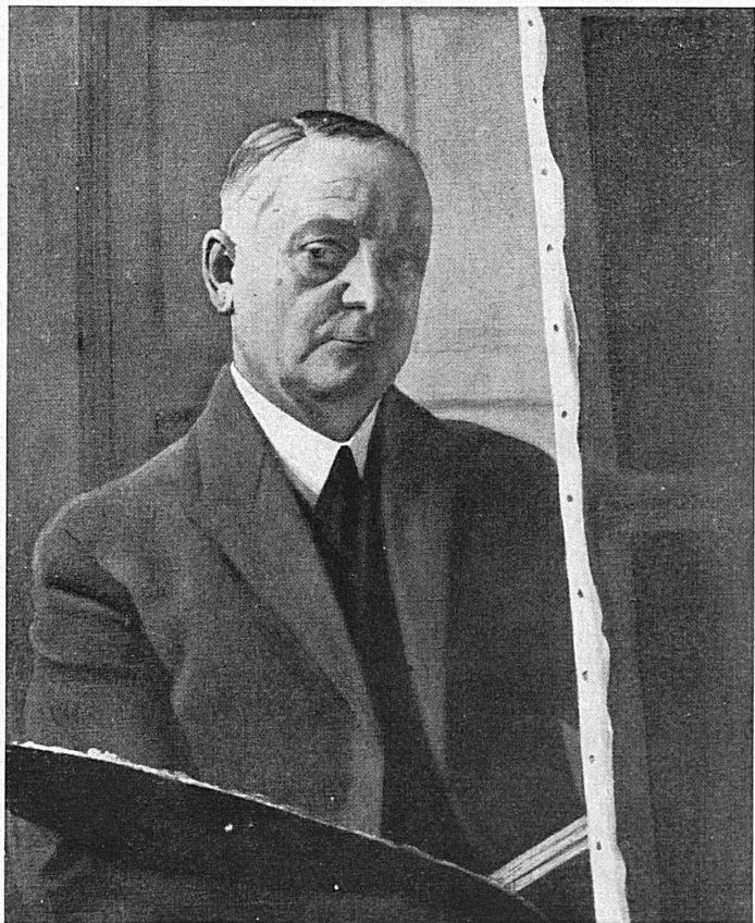
Paysage, par Félix Vallotton. — Félix Vallotton: Portrait de l'artiste.