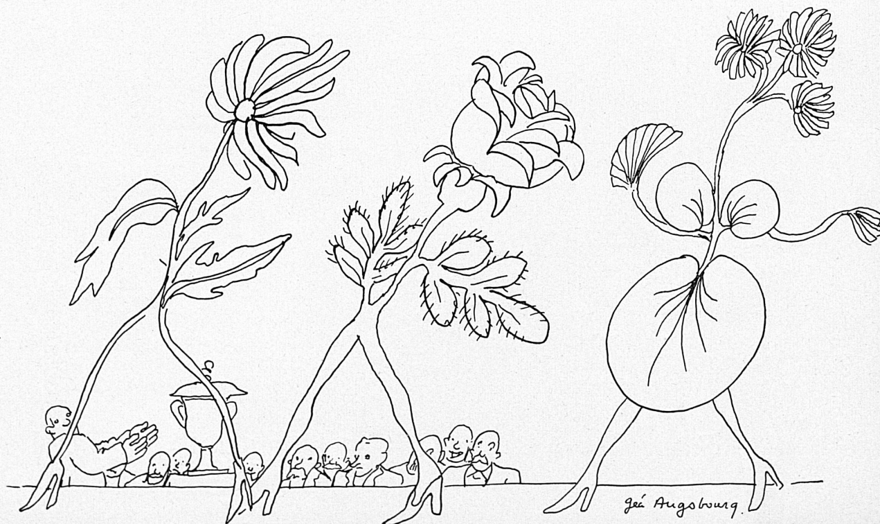
A droite : Défilé de la fleur et de la robe. Rechts: Die Modeschau.