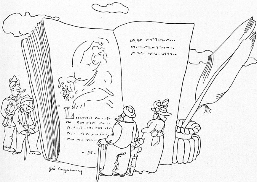
En haut : Aux stands du Livre. Oben : An der Büchermesse.

Le Comptoir étant également la mission des congrès offrira aux séances et assemblées qui s'y tiendront des salles de conférences rénovées.