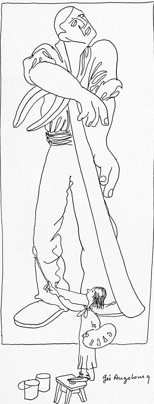
A gauche : Les peintres au travail. A droite : La fosse aux ours de Berne.