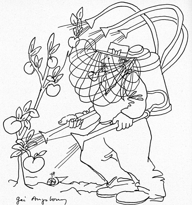
A droite : La guerre aux parasites. Rechts : Die Schädlingsbekämpfung.

La distribution et l'aménagement des halles a subi, de son côté, d'heureuses transformations. Le pavillon de