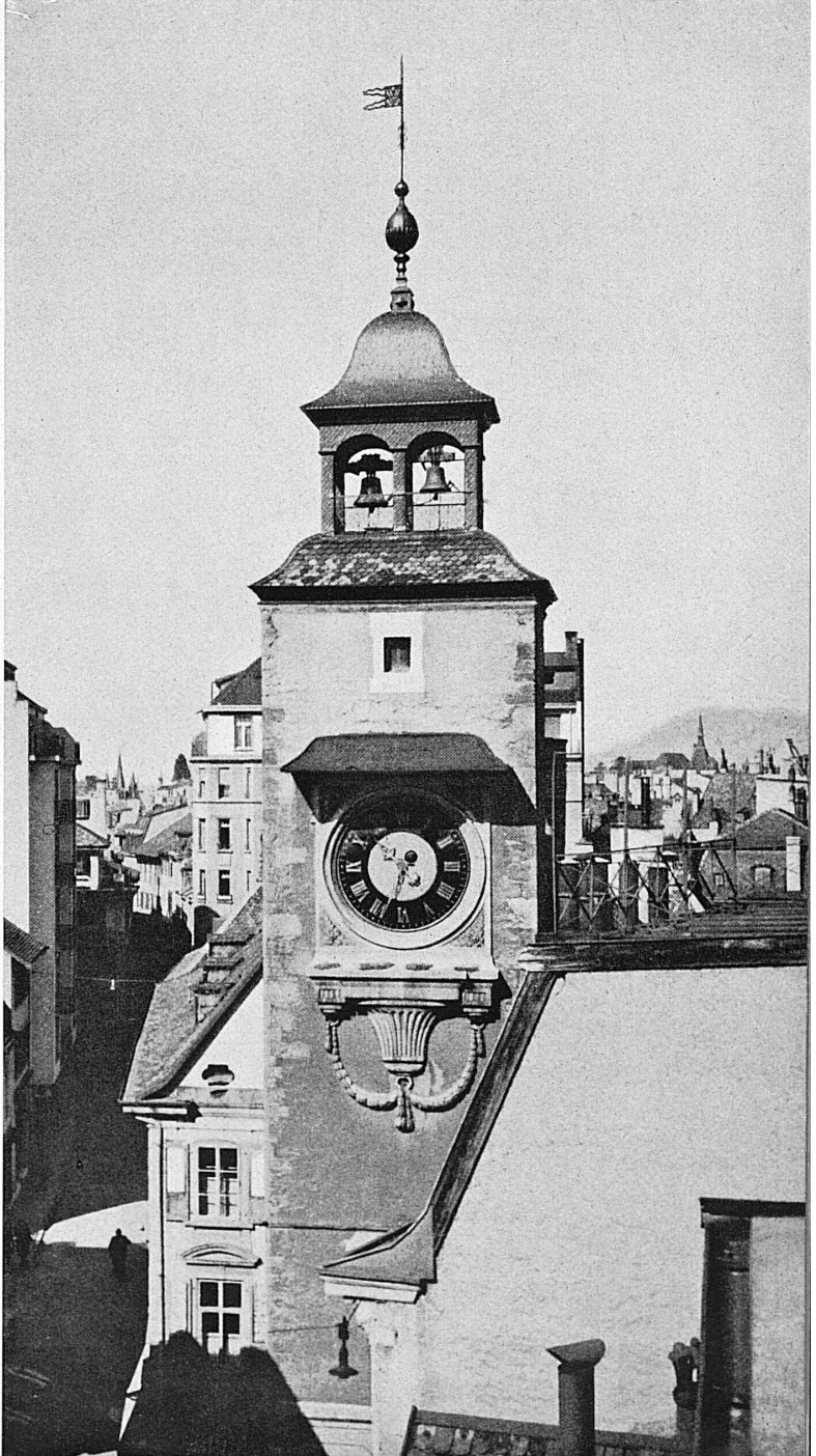
Links außen: Der Fischerhafen von La Tour-de-Peilz; der Kahn rechts trägt — zur Erinnerung an den großen Maler, der hier seinen Lebensabend verbrachte — den Namen Courbet.* Links: Ein wetterharter « Sauveteur du Lac ». Rechts: Der Turm des Rathauses von Vevey.