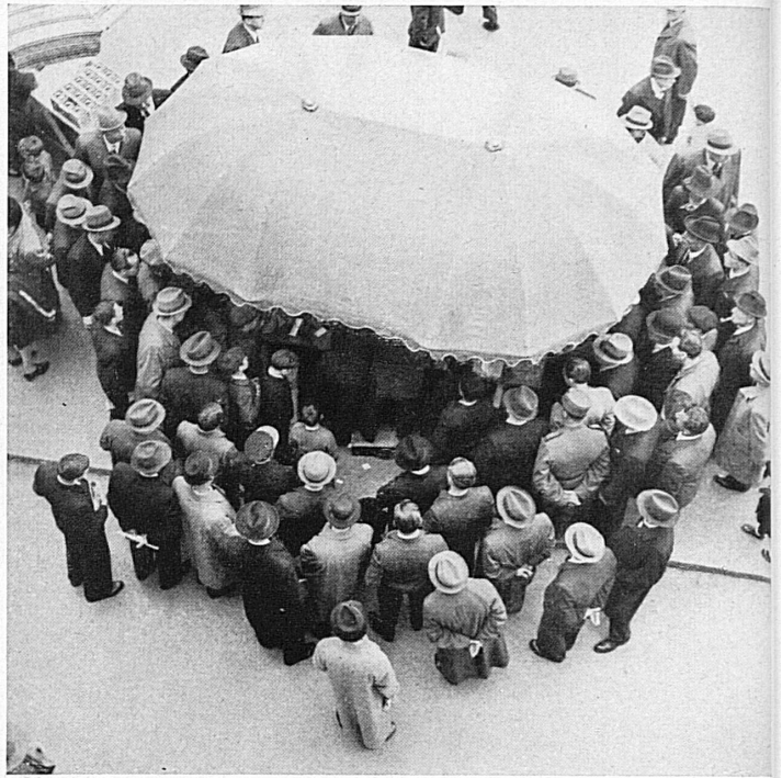
Was hat er wohl feil, der billige Jakob unter seinem merkwürdigen Riesenschirm?

Der Petersplatz ist geblieben. Die Messe auf dem Barfüßerplatz ist wieder da. Wie schön — und hoffentlich doch nicht für lange Zeit mehr! Zwiespältig ist die Freude in dieser Hinsicht. Vorerst aber freut man sich, daß die Kriegsverhältnisse wenigstens den Baslern einmal