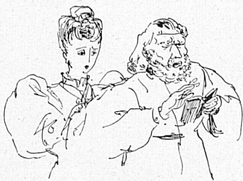
Zeichnungen von H. Steiner. Oben: «Und das Licht scheinete in der Finsternis», von Tolstoi, im Berner Stadttheater. Seite rechts oben: «Othello», von Verdi, im Basler Stadttheater. Mitte: «Die Fliegen», von Sartre, im Zürcher Schauspielhaus. Unten: Russisches Ballet, zur Aufführung des «Fürst Igor» von Borodin, im Zürcher Stadttheater.