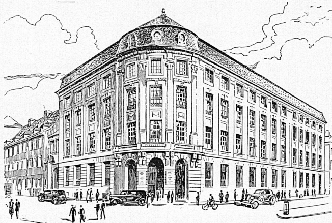
Bankgebäude in Basel — Hôtel de la banque à Bâle

SOCIÉTÉ DE BANQUE SUISSE ☆ SOCIETÀ DI BANCA SVIZZERA ☆ SCHWEIZERISCHER BANKVEREIN ☆ SWISS BANK CORPORATION ☆ SOCIÉTÉ DE BANQUE SUISSE ☆