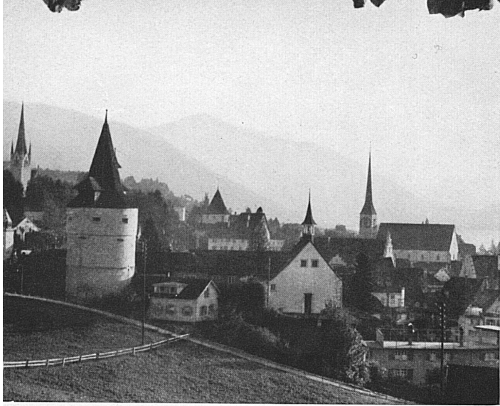
Blick über die türmereiche Altstadt gegen die Rigi.* Les nombreuses tours de la vieille ville de Zoug se profilent contre le Righi.