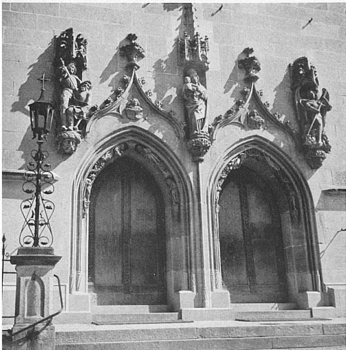
Ein Kleinod der Architektur ist die St. Oswaldskirche in Zug. In reinstem spätgotischem Stil zu Ende des 15. und bis in die Mitte des 16. Jahrh. erbaut, entzückt sie jeden Kunstfreund durch ihren edlen Aufbau, ihre einfach-vornehme Fassade und vor allem ihren plastischen Schmuck. Die Aufnahme zeigt das Hauptportal mit einer Madonnenfigur in der Mitte und Statuen der Heiligen Michael und Oswald rechts und links.

Noch ist dieses Stadtbild fast unverfälscht geblieben. In wohlausgeglichenen Straßen und schmucken Gassen erstet das mittelalterliche Zug. Wohnlicher geworden, neuzeitlichen Bedürfnissen angepaßt, sind die alten Patrizier- und Bürgerhäuser. An ihrem charaktervoll einheitlichen Grundgehalt aber wurde wenig geändert. Bewehrte Türme, altertümliche Brunnen, malerische Wappen und Schilder und nicht zuletzt die reiche Gotik von St. Oswald erhalten das angestammte Gepräge. Zug haftet nicht der kleinstädtische Charakter an, den wir in all jenen Städtchen und Städtlein des Mittellandes finden, welchen das Stadtrecht einst wie ein Wunder in den Schoß gefallen ist. Noch atmet die alte Stadt den Zauber ihrer eidgenössischen Vergangenheit; nichts läßt vergessen, daß sie stets Mittelpunkt des Standes Zug gewesen ist. Mittelpunkt, nicht Haupt. Zug war keine Stadtrepublik. Stadt und Landgemeinden waren gleichberechtigte Glieder des Staatswesens. Die Landgemeinde verteilte die Würden und Bürden des Staates an den Söldneradel und die Bürgergeschlechter der Stadt, die Zurlauben, Kolin, Landtwing, Speck, Bossard, Wickart und Brandenburg, wie an die Schmid und Schicker