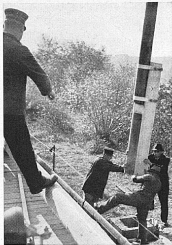
Links: Die Holzmasten werden auf einen speziellen Materialwagen verladen, um am vorgeschriebenen Platz aufgestellt zu werden. — Rechts: Der Stellvertreter des Bahnmeisters dirigiert das richtige Maststellen.