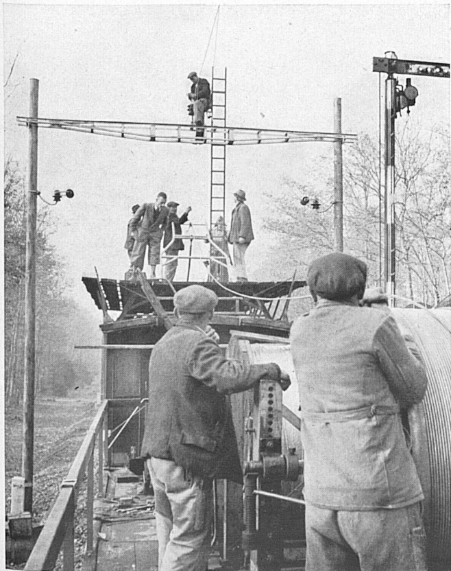
Der Fahrdrat wird montiert. Montage de la ligne de contact.

Gibt man sich wohl genügend Rechenschaft über den Segen der Elektrifikation gerade während dieses Krieges, wo der Straßenverkehr durch Treibstoffnot und Schwierigkeiten der Pneubeschaffung weitgehend versiegt und wo die Schiene wiederum den weit überwiegenden Teil aller Personen- und Gütertransporte übernehmen mußte? Weiß es die Öffentlichkeit wirklich zu schätzen, daß die Bundesbahnen im Jahre 1943 volle 177 Millionen Reisende zu befördern vermochten, wo sie vor dem Kriege ihrer nur 113 Millionen hatten, und daß sie in dieser Zeit die Zahl der gefahrenen Personenkilometer in einem noch viel stärkeren Verhältnis von 2867 auf 4718 Millionen steigerten? Würdigt es die Bevölkerung genügend, was es heißt, daß die SBB 1943 23,3 Millionen Tonnen Güter transportierten, während es im letzten Vorkriegsjahr nur 13,9 Millionen waren, und daß sie im Güterverkehr 3,52 Milliarden Tonnenkilometer bewältigten, ihre Verkehrsleistung gegen die 1585 Millionen von 1938 also weit mehr als verdoppelten? Nur der elektrische Betrieb setzte unsere Staatsbahn in den Stand, dem Lande in ungebrochener und fast unbegrenzter Leistungsfähig-