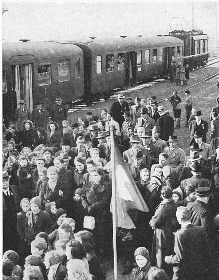
Der Eröffnungszug mit seiner festlich bekränzten Lokomotive auf der Station Sisseln. — Le premier train électrique à Sisseln, entre Stein et Laufenburg.

Da aber auch die Elektrifikation der wenigen noch mit Dampf betriebenen Privatbahnen rasche Fortschritte macht, wird die Schweiz in wenigen Jahren ein praktisch gänzlich mit einheimischer Energie betriebenes Schienennetz besitzen. So werden sich die Bahnen auf einer neuen Ebene mit dem dannzumal freilich ebenfalls weiterentwickelten und vervollkommenen Motorfahrzeug messen können. Den Bundesbahnen aber obliegt die Hauptaufgabe in diesem Kampf der Bahnen um ihren Anteil an den Transportaufgaben des Landes im Rahmen einer wesensgemäßen Verkehrsteilung zwischen Schiene und Straße. Saniert, elektrifiziert und auch im übrigen durchgehend modernisiert, werden sie dieser Aufgabe wohl zu begegnen wissen. H. W. Th.