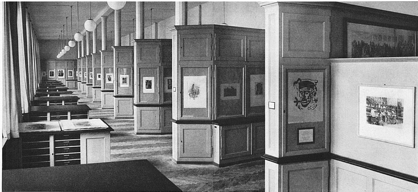
Le vaste sale per le esposizioni della «Collezione grafica» del Pol. Fed. a Zurigo nelle quali si alternano numerose le esposizioni.

Der große Ausstellungsraum der Graphischen Sammlung der Eidg. Technischen Hochschule in Zürich, in welchem wechselnde Ausstellungen stattfinden.