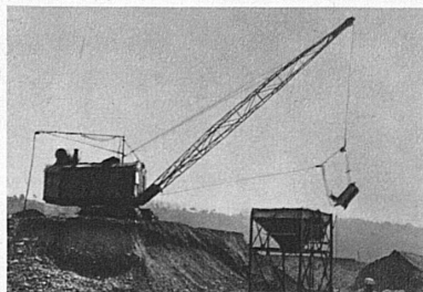
Draglines, flèche 20 m.

beim Bau der Flugplatzanlagen von Cointrin Genf, beim Freilegen von Braunkohle in den Bergwerken von Zell (Luzern), bei der Rodung des Geländes für Tabakkulturen in der Rhoneebene.