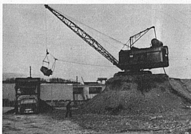
Rendement journalier 600 m 3 .