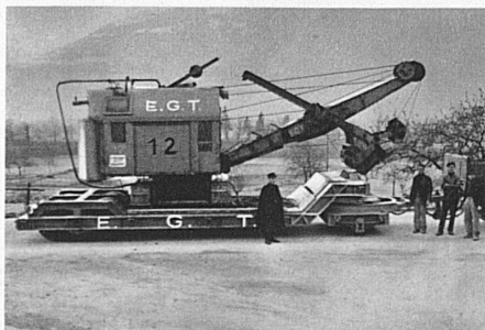
Moyen de transport de l'Entreprise: chariot 24 roues 60 tonnes.