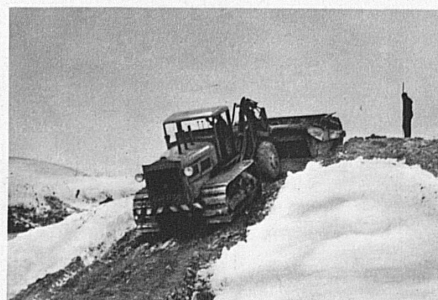
Train de scrapers. Rendement journalier 500 m 3 , 22 tonnes.