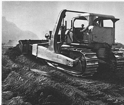
Bulldozer 18 tonnes.