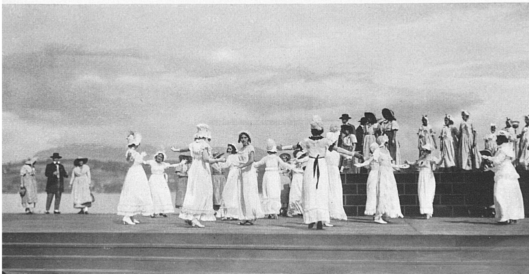
Valse du festival «Genève chante», de Jaques-Dalcroze, représenté en été 1937, en plein air sur les rives du Léman.