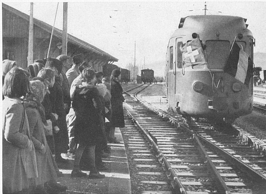
Arrivée aux Verrières, le 1 er décembre, du premier autorail du service régulier entre Paris et Les Verrières, via Pontarlier. — Ankunft des ersten Triebwagens von Pontarlier her in Les Verrières. Am 1. Dezember wurde der reguläre Betrieb zwischen Paris und der Schweizer Grenzstation aufgenommen.*