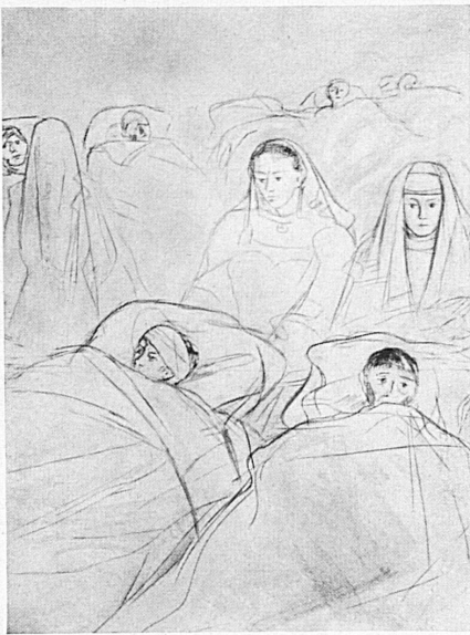
Charles Hug — «Der Gefangenentransport» — erscheint, allenthalben ein schöner Erfolg beschieden sein!