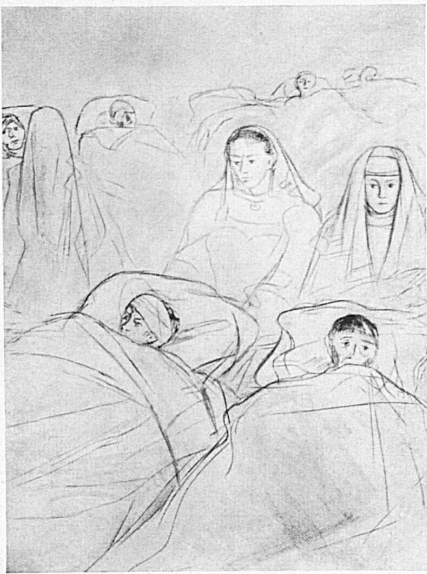
Charles Hug — «Der Gefangenentransport» — erscheint, allenthalben ein schöner Erfolg beschieden sein!