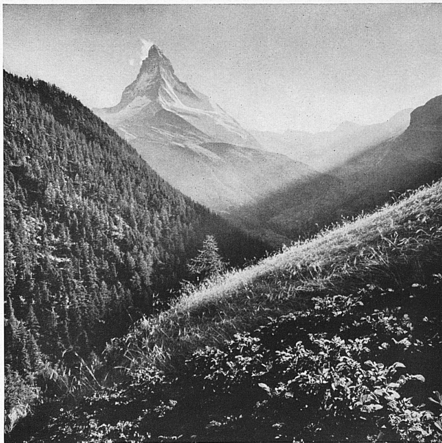
Das Matterhorn. Abendlicher Blick ins Zmutt-Tal. Le Cervin. Paix du soir dans la vallée de Zmutt.

Seilers Schlagwort, « Das Matterhorn, der gewaltigste Unglücksberg Whymper's », brachte eine Flut von Alpinisten nach Zermatt. Whymper blieb dem Matterhorn-