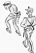
Zeichnungen von Otto Müller.

ein Polizist einen Bösewicht dorthin spedierte, wo er hingehört, es bleibt die Verschiedenheit, die große Vielfalt der Bestimmungen, zu der all diese Leute verpflichtet oder berechtigt sind zu reisen. Dies zeichnete dem Auskunftsbüro seine Aufgabe vor: Es soll und will dem Publikum ein Führer durch die Vielgestaltigkeit der Tarife und Fahrpläne sein. —